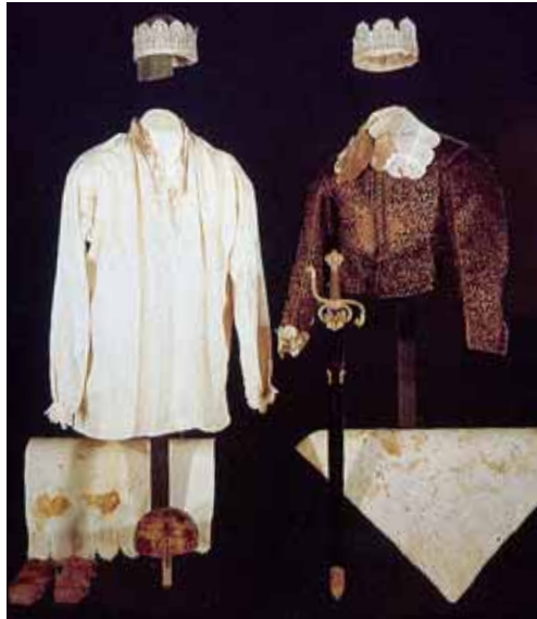
Figur 4. Christian IV's blodige klæder fra slaget ved Kolberger Heide 1. juli 1644. Udstillet på Rosenborg Slot.

Udover Christians egen beskrivelse af, at det var højre øje, der blev ramt, kan det ses på det tøj, som han havde på under slaget, og som senere blev gemt og opbevaret på Rosenborg(Fig.4). Det ses tydeligt, at læsionen var på højre side. I mange år blev tøjet opbevaret i tronkammeret på Rosenborg i "et liden skrin, overstrøet med stråblomster". I 1839 blev det flyttet til Chr. IV's rum i stueetagen, hvor det siden 1900 har været tilgængeligt for besøgende.