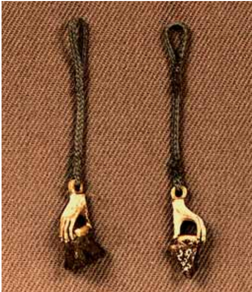
Figur 5. Vibeke Kruses ørehængere. 2 små guldhænder holder henholdsvis et stykke jern og et stykke bronze. Begge stykker fjernet fra Christian IV's ansigt.

som mente, at kongen havde fået en betydelig kontusion af øjet, der rimeligvis havde fremkaldt en stærk blødning i øjets indre, hvorved han straks havde mistet synet. Senere var der så kommer sekundære betændelsesforandringer i øjets indre, hvorved dette er atrofieret og formindsket i alle sine diametre. Sperlings udtalelse om at øjelågene ved kongens død havde lukket sig over det syge øje, stemte godt hermed.