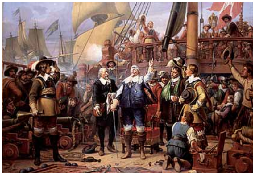
Figur 3. Kong Christian ved højen mast. Malet på sidevæggen af Christian IV's kapel i Roskilde Domkirke. Marstrand 1866

I forarbejderne til Marstrands store billede fra 1866 ses også skaden på venstre side. Det blev dog rettet i den færdige version af billedet, som fylder hele den ene sidevæg i Christian IV's gravkapel i Roskilde Domkirke (Fig. 3)