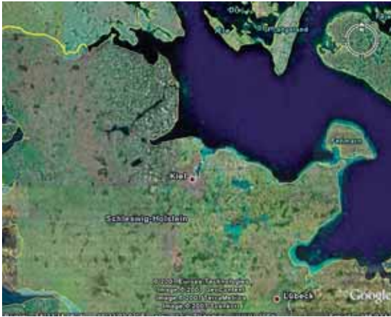
Figur 2. Kieler Bugt er farvandet mellem Femern, Lolland, Langeland og Slesvig-Holsten. Kolberger Heide er betegnelsen for den del af bugten, der ligger nærmest fastlandet ud for Kiel Fjorden. (Gengivet med tilladelse fra Google Earth).

gelige Bibliotek Chr. Bruun i 1879 (3). Han skriver om selve slaget (i parentes angives med D eller S om det er en dansk eller en svensk kilde):